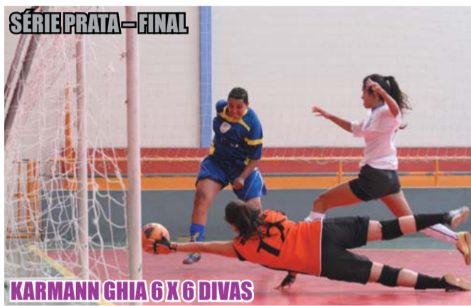
SÉRIE PRATA – FINAL