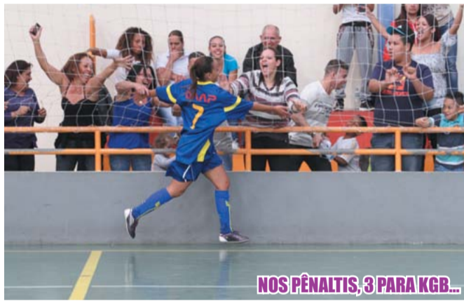
NOS PÊNALTIS, 3 PARA KGB...