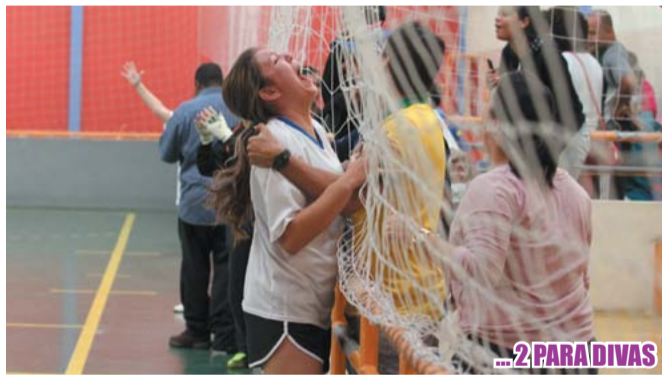
...2 PARA DIVAS