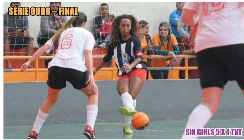
SÉRIE OURO – FINAL