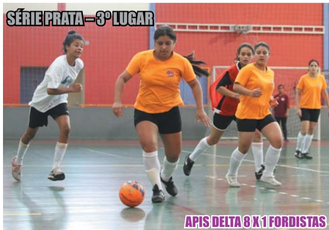
SÉRIE PRATA – 3º LUGAR